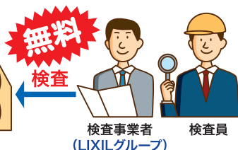
検査事業者 (LIXILグループ) 検査員